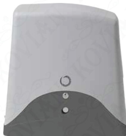
Rozměry pohonu TURBO200

Nová HD verze s chladícím ventilátorem a cirkulací vzduchu.